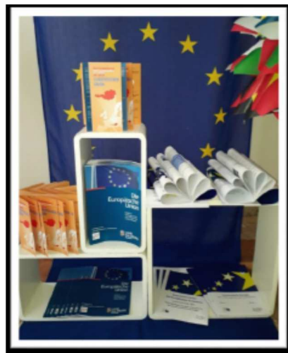
LBS St. Johann im Pongau

Alle besuchten Schulen haben nicht nur die Mindestkriterien erfüllt, sondern auch darüber hinaus zahlreiche Aktivitäten rund um das Thema Europa gesetzt und sind auch zum Teil bereits sehr gut mit anderen Schulen im In- und Ausland vernetzt.